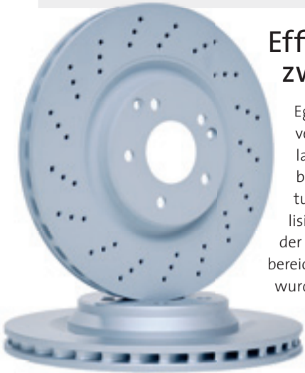
Korrosionsschutz für Bremscheiben