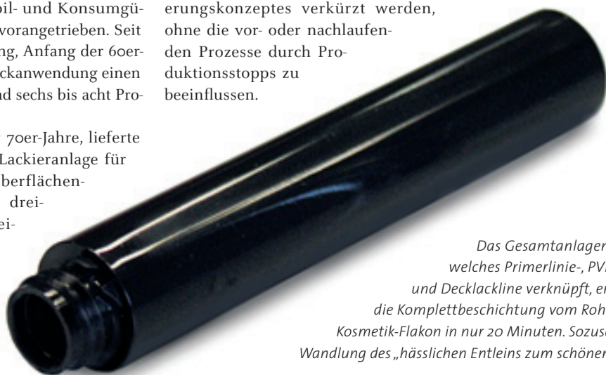
Das Gesamtanlagenkonzept, welches Primerlinie-, PVD-Anlage und Decklacklinie verknüpft, ermöglicht die Komplettbeschichtung vom Rohteil zum Kosmetik-Flakon in nur 20 Minuten. Sozusagen die Wandlung des „hässlichen Entleins zum schönen Schwan“

ist die Vorbehandlung mit Ionisation, Beflammung und Bürststation, Primer-Vorlackierung, Zwischenabdunstzone und die Primer-Lackierung, sowie die Infrarotabdunstzone und ein UV-Trockner mit Kühltunnel enthalten. Um den Flächenbedarf in der Konzeptionsphase zu definieren, wurde auf Vergleichswerte von branchenüblichen Lacken zurückgegriffen, hierbei wurde für den Prozess der UV-Exposition fünf Sekunden und für das Abdunsten der Teile sechs Minuten angenommen.