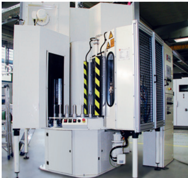
Rundautomat für Gummi-Metall-Bindemittelteile, zukünftig auch mit Lackierroboter