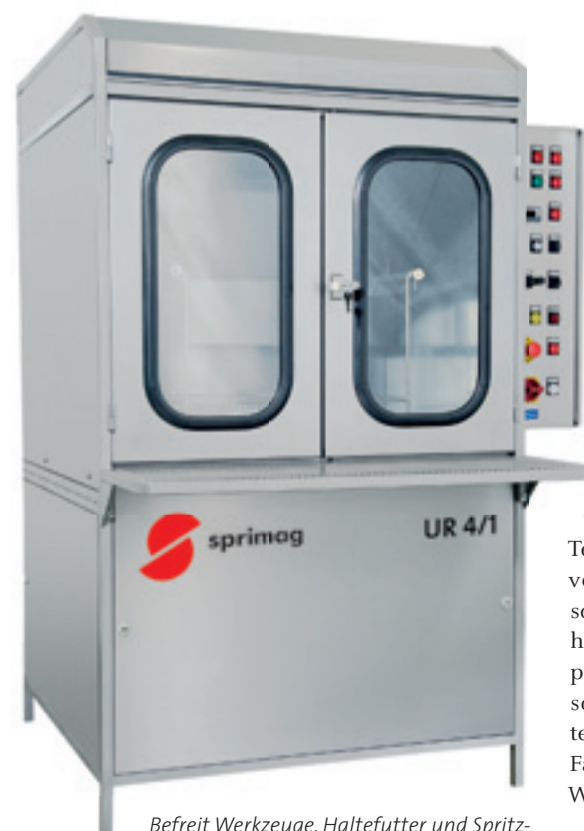
Befreit Werkzeuge, Haltefutter und Spritzapparate von Lackverschmutzungen