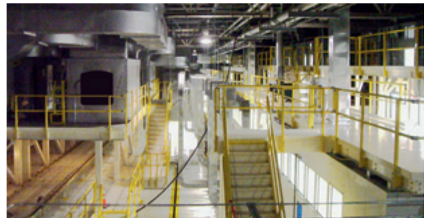
Die Stoßfänger-Lackieranlage wurde über drei Ebenen konzipiert und erstreckt sich über eine Gesamtlänge von 65 Metern