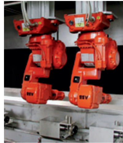
Minimierung des Oversprayanteils durch den Einsatz von Lackierroboter