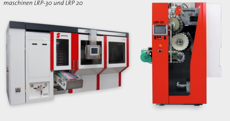
Die gemeinsam realisierten Inspektionsmaschinen LRP-30 und LRP 20