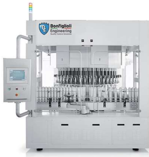
Die Maschine vom Typ KBA ist eine der bekanntesten und meistverkauften Bonfiglioli Maschinen und wird für das Prüfen von 3-teiligen Aerosoldosen eingesetzt