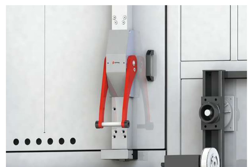
Neue Schließmechanik an den Trocknertüren