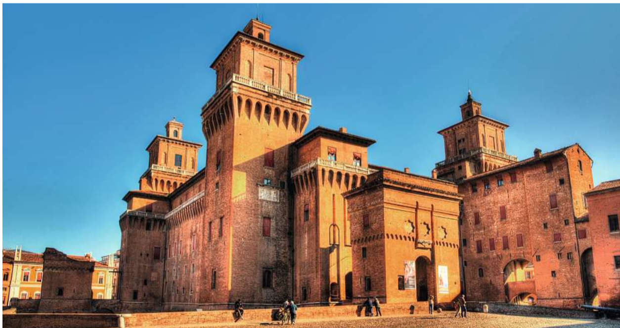
Unternehmenssitz von Bonfiglioli ist die oberitalienische Stadt Ferrara, deren Wahrzeichen das Castello Estense ist

Bonfiglioli deckt heute verschiedenste Industriebereiche mit seinen Prüftechnikprodukten ab, insbesondere die