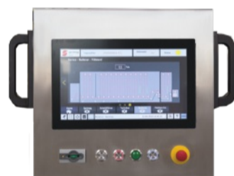
Sicherer Betrieb durch Überwachungs- und Regelsysteme

letzten Jahre betrachtet mehr als zehn ausgelieferten Anlagen pro Jahr konnte gerade durch die konsequente Umsetzung der Detailverbesserungen der Vorsprung zu Wettbewerbsausführungen nochmals weiter ausgebaut werden. Durch eine deutlich verbesserte Türschließmechanik sind die Trockner zukünftig noch einfacher und sicherer zu öffnen und zu schließen. Die neue Mechanik sorgt dabei für eine perfekte Abdichtung. Die neue Trocknergeneration