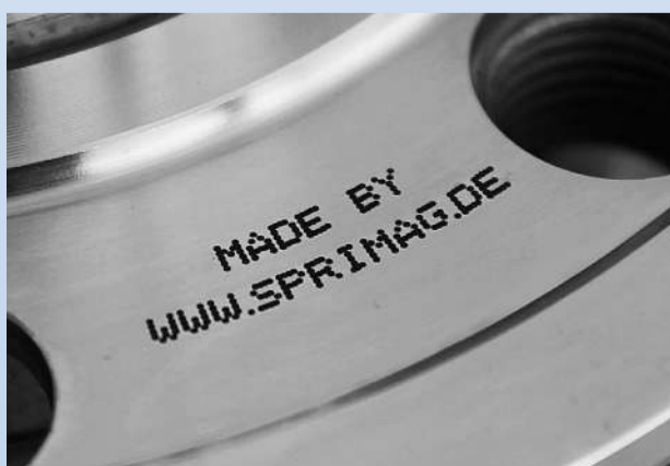
Der Data Matrix Code wird mittels Inkjet auf die Radlager appliziert