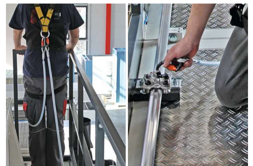
Das einseitige Geländer mit Einhängfixpunkten sorgt für mehr Sicherheit